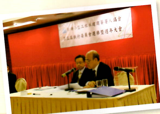
由區載佳SBS監票並公佈獲選名單