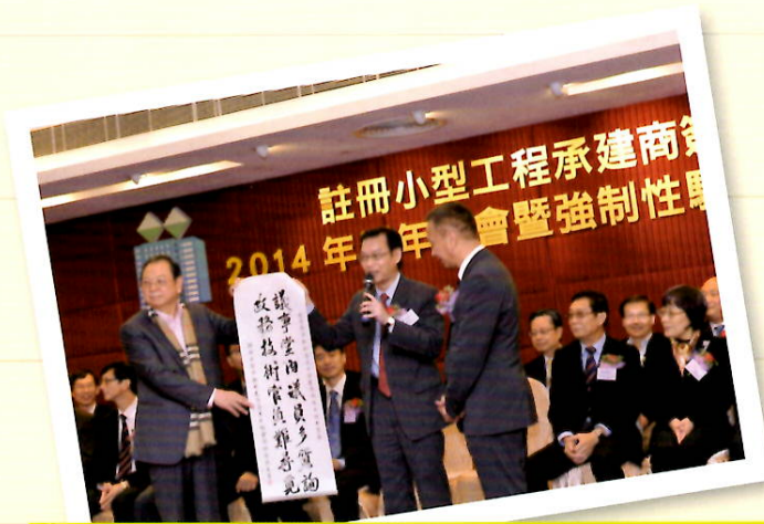
本會送贈字畫予 發展局常任秘書長(工務) 韋志成JP