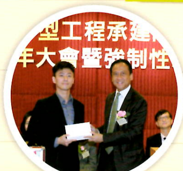
問答遊戲得獎者獲三星智能手機1部