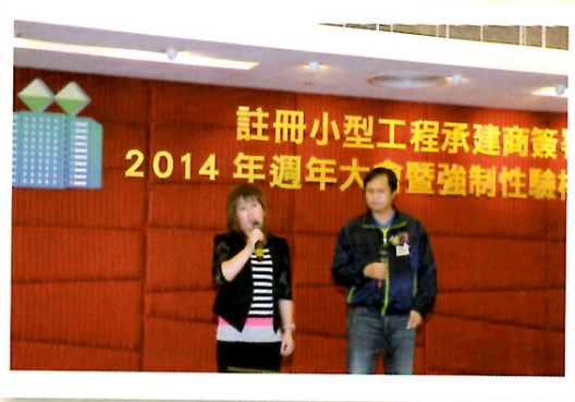
建造業工地傷亡個案分享 及安全演講