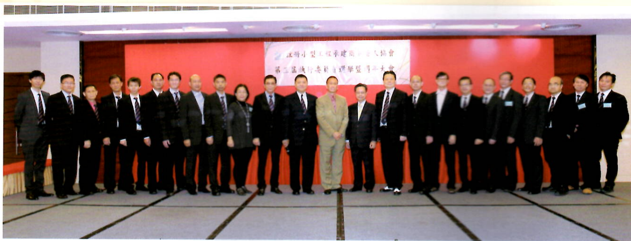
第三屆委員選舉產生後大合照