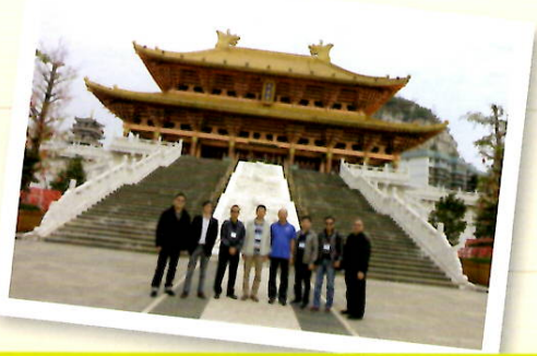
屋宇署張天祥副署長及同事 與本會代表合照