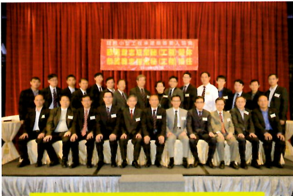
嘉賓與委員大合照