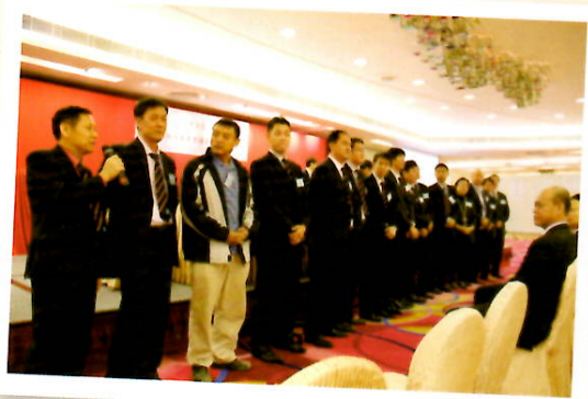
候選委員用1分鐘 作自我介紹給投票會員