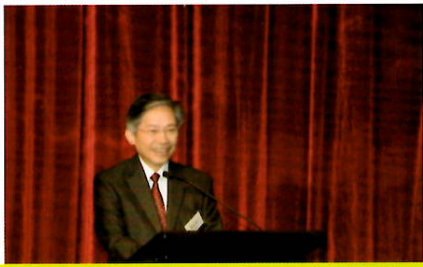
發展局候任常任秘書長(工務)韓志強JP致辭