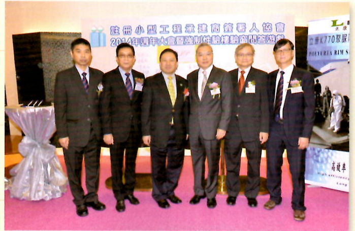
職安局及綠色議會主席黃天祥JP 與委員合照