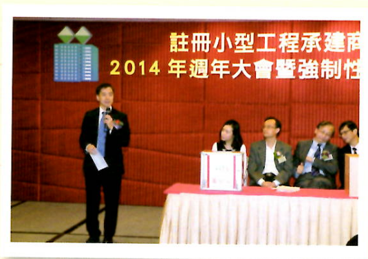
屋宇署署長 許少偉JP 在問答遊戲完結後作總結及評論