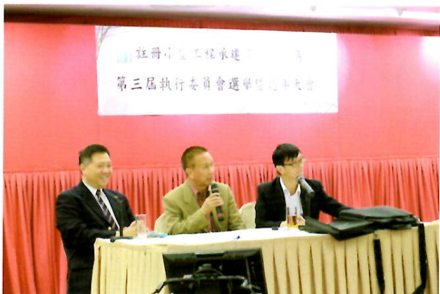
主席匯報2013及2014年工作報告