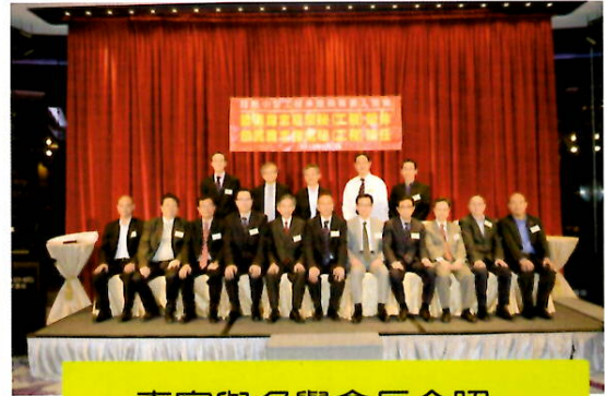
嘉賓與名譽會長合照