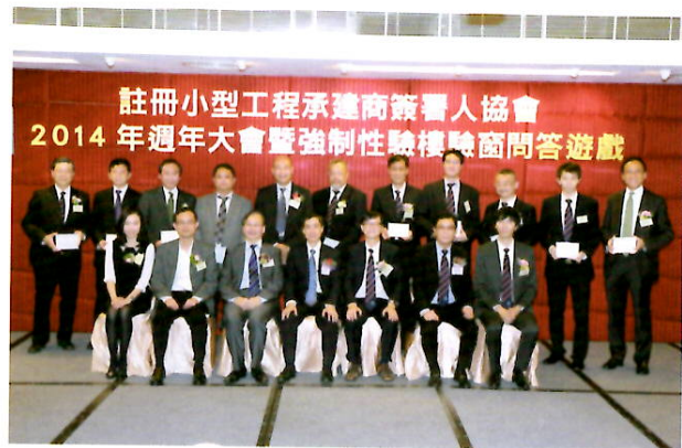
大會評審團 與問答遊戲獎品贊助商合照