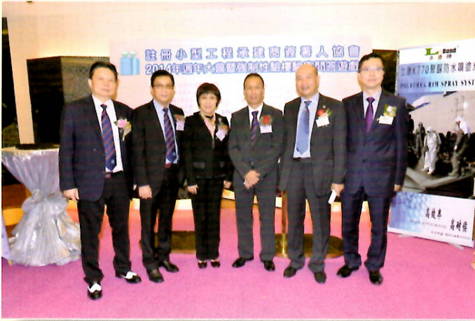
主席及委員與中聯辦代表合照