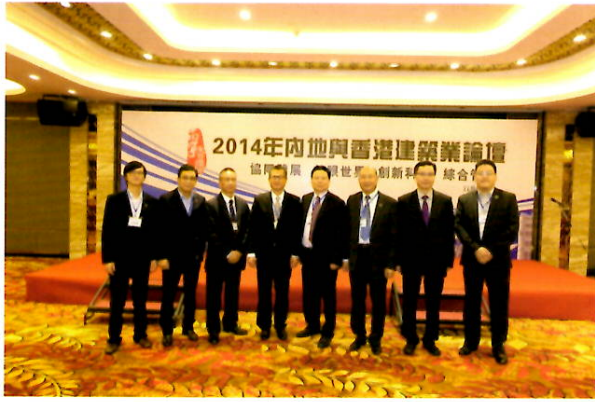
發展局陳茂波局長與本會代表合照