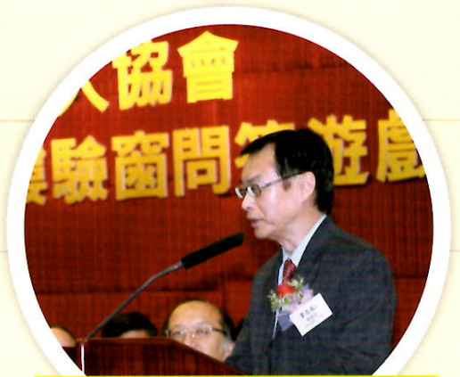
發展局常任秘書長(工務) 韋志成JP致辭